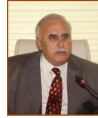
Nuh KARA MHP Merkez